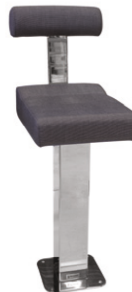
P 230 Q Supporto rettangolare Rectangular support